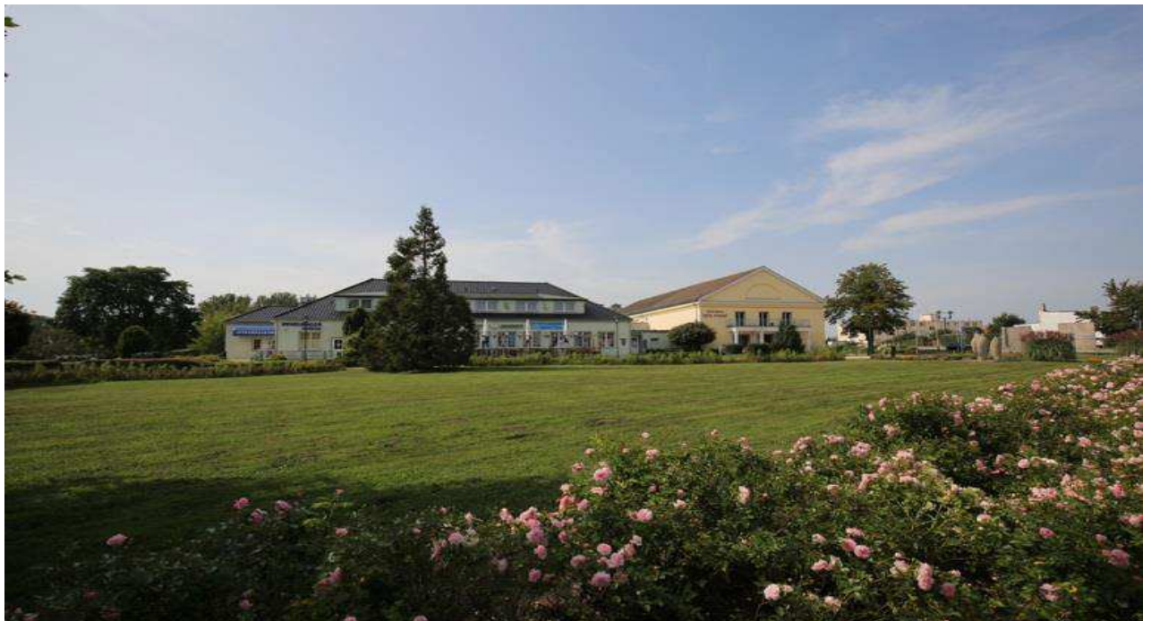
Kulturhaus „Erich Weinert“ als Veranstaltungszentrum mit Bowlingbahn

Büro: Frankfurter Allee 272 10317 Berlin