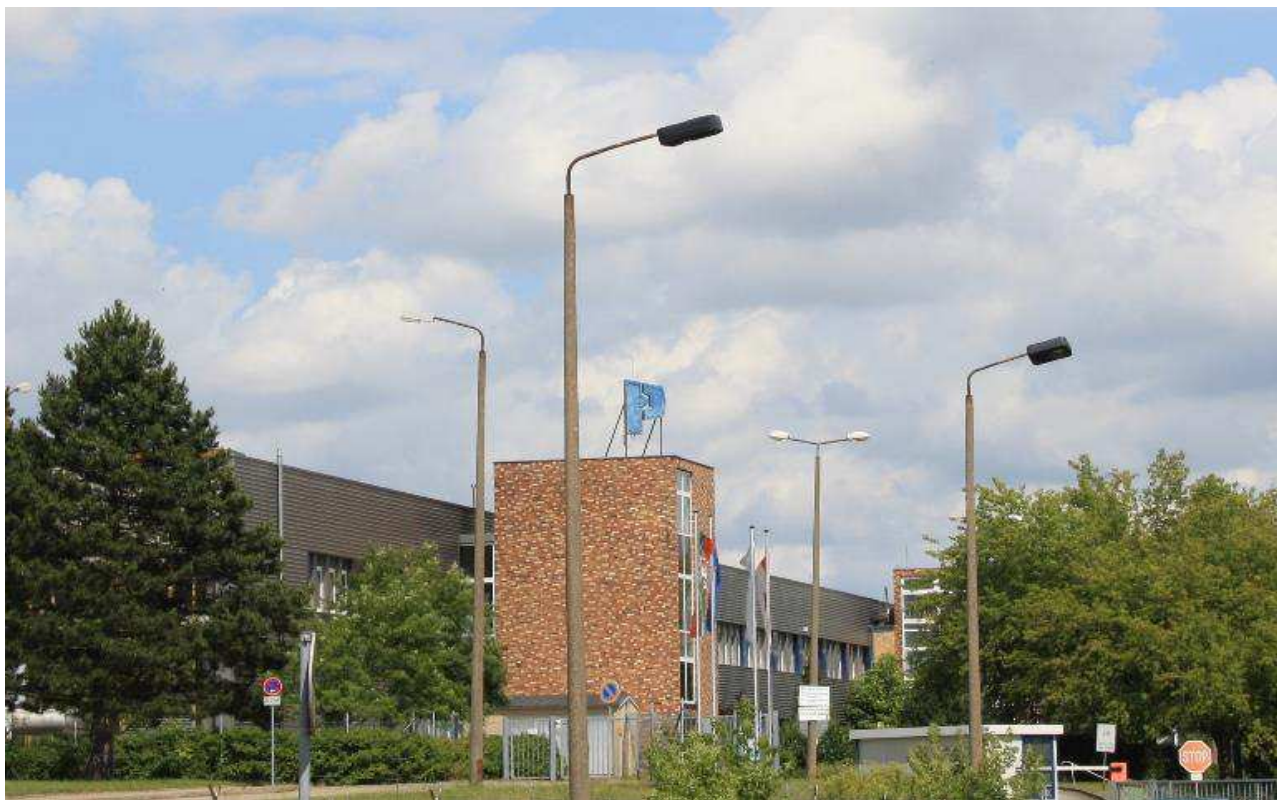
Zahnradwerk im Gewerbegebiet „Pritzwalk-Ost“ entlang der Wittstocker Chaussee

Büro: Frankfurter Allee 272 10317 Berlin