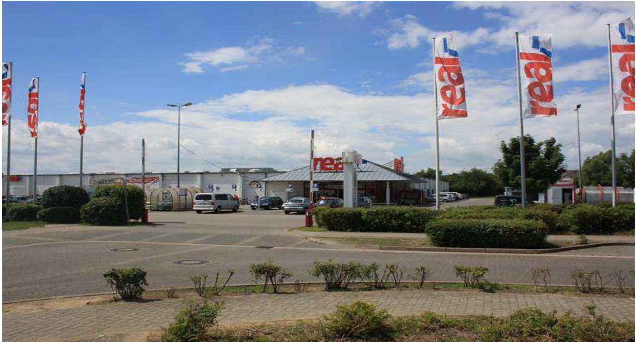
Zahlreiche Einkaufsmöglichkeiten im Gewerbegebiet-Nord, u.a. mit Real, Lidl, Rossmann, u.a.

Wir vermitteln und verwalten für Sie Haus- u. Grundbesitz