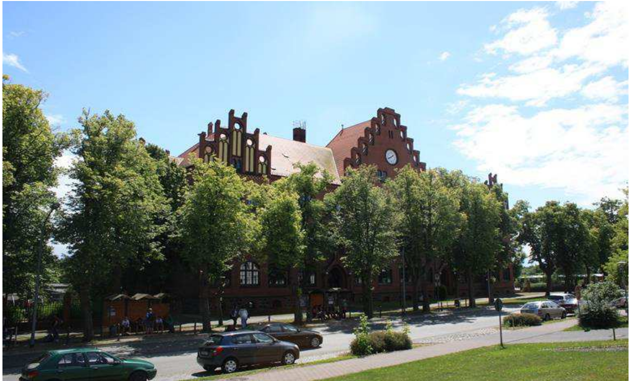
Mehr als 100 Jahre altes „Johann-Wolfgang-von-Goethe-Gymnasium“ mit etwa 450 Schülern

Wir vermitteln und verwalten für Sie Haus- u. Grundbesitz