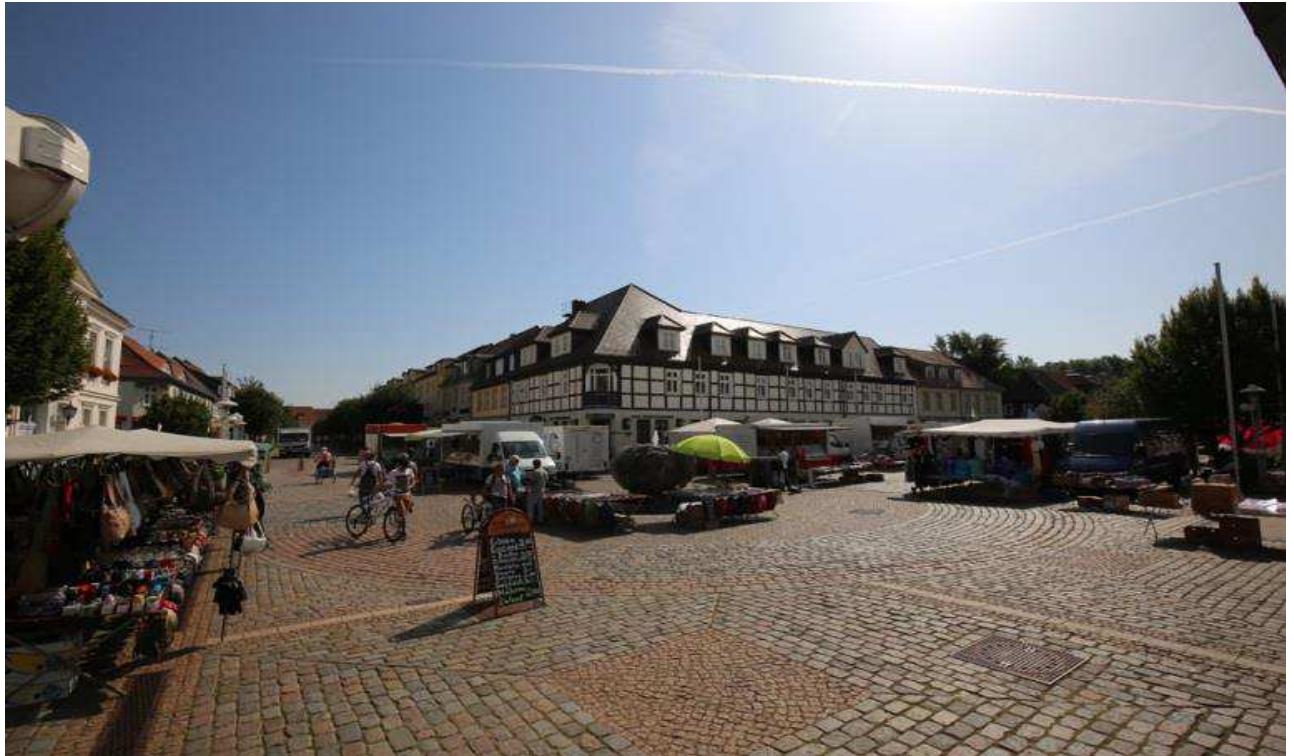
Wochenmarkt Pritzwalk im Zentrum der historischen Altstadt

Wir vermitteln und verwalten für Sie Haus- u. Grundbesitz