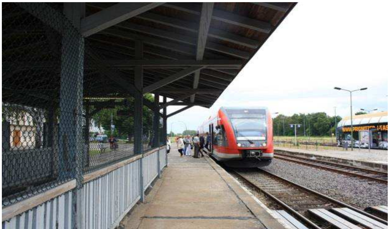
Gut frequentierter Regionalbahnhof mit Verbindungen nach Berlin und Hamburg

Büro: Frankfurter Allee 272 10317 Berlin